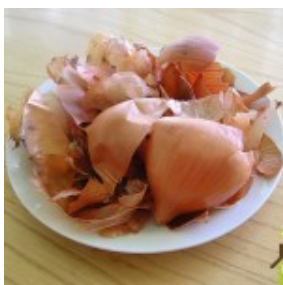
Ljuske sa crnog luka

2. Ljuske crnog luka (ja sam ih sakupljao tokom 2-3 nedelje, količina sa oko 2 kilograma crnog luka) mada se mogu kupiti na pijaci