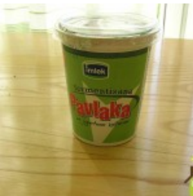
Kisela pavlaka (velika)