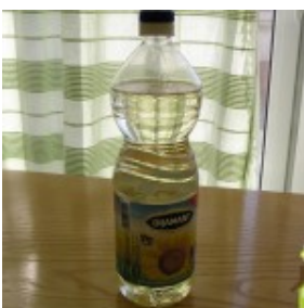
Ulje jestivo suncokretovo