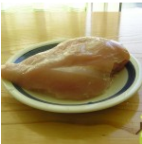
Pileće belo meso