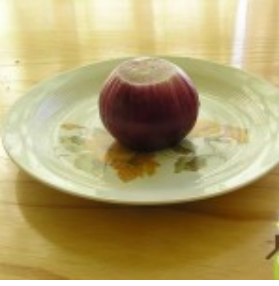
Crni luk (crveni)